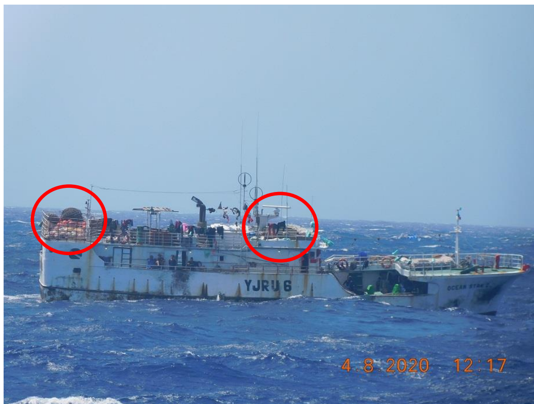
Figure (B). Photographie par la garde-côtière des Etats-Unis du FV OCEAN STAR NO 2 lors de la patrouille du 8 avril 2020. Le cercle rouge identifie les engins de palangre observés sur les ponts du navire.