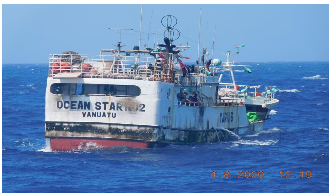
Figure (C). Photographie par la garde-côtière des Etats-Unis du FV OCEAN STAR NO 2 pendant la patrouille du 8 avril 2020. Le cercle rouge met en évidence le nom du navire et de l'État du pavillon peints sur la poupe du navire.