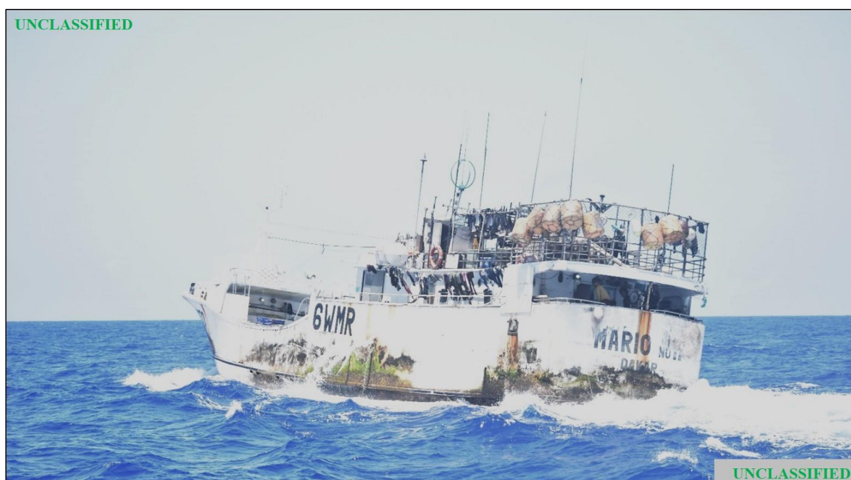
Figure (A). Emplacement du FV OCEAN MARIO N° 11 observé par la garde-côtière des États-Unis lors de la patrouille du 6 mai 2020.