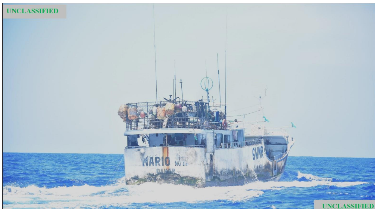
Figure (B). Photographie du FV OCEAN MARIO N° 11 prise par la garde-côtière des États-Unis lors de la patrouille du 6 mai 2020.