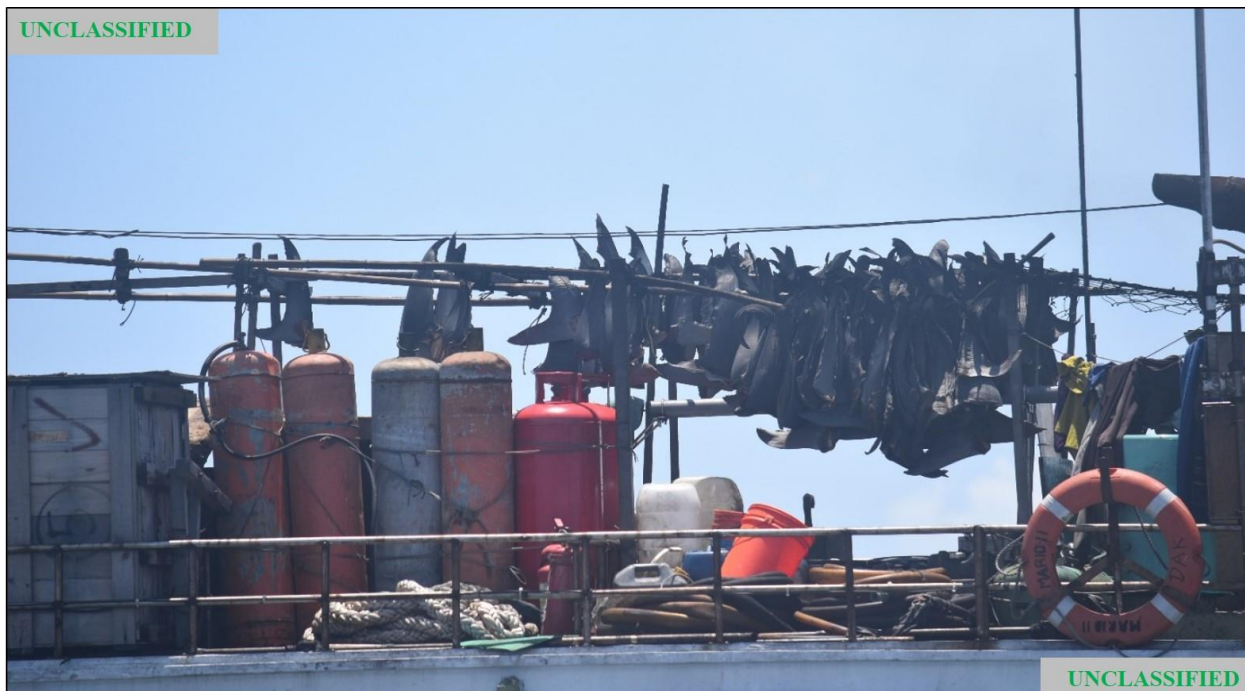
Figure (D). Photographie du FV MARIO N° 11 prise par la garde-côtière des États-Unis pendant la patrouille du 6 mai 2020 montrant un gros plan des ailerons de requins suspendus au-dessus du pont.