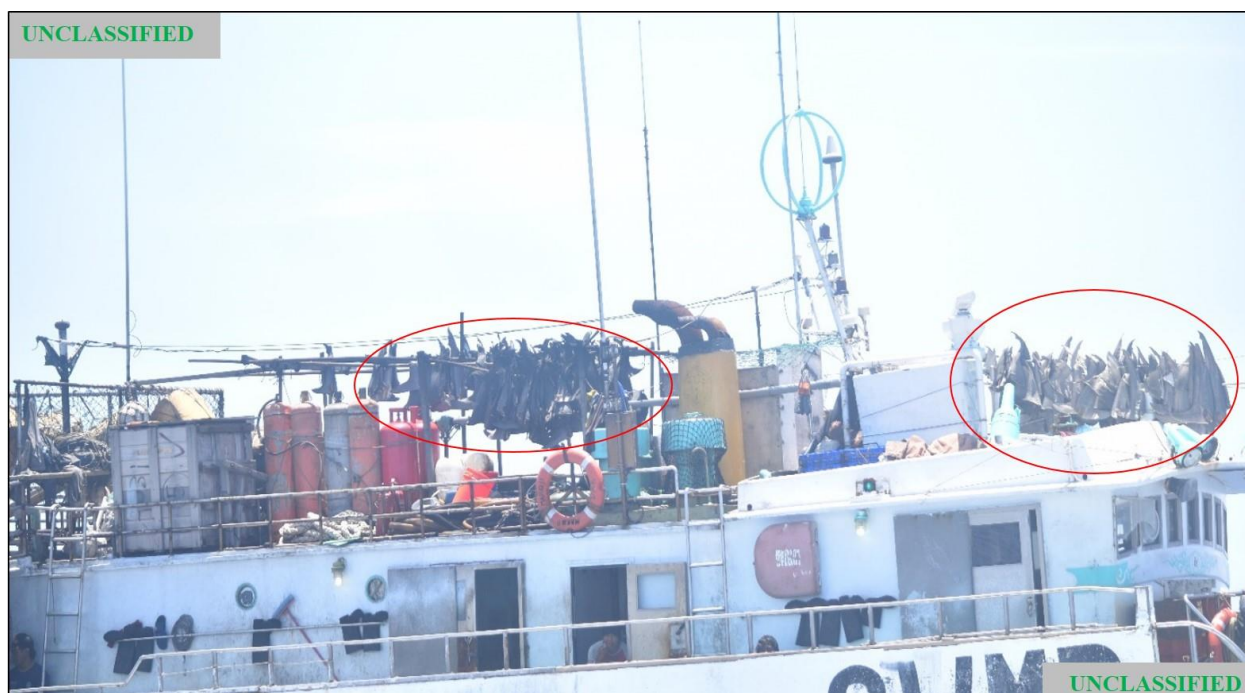
Figure (C). Photographie du FV MARIO N° 11 prise par la garde-côtière des États-Unis pendant la patrouille du 6 mai 2020. Le cercle rouge met en évidence les ailerons de requins qui pendent au-dessus des ponts.